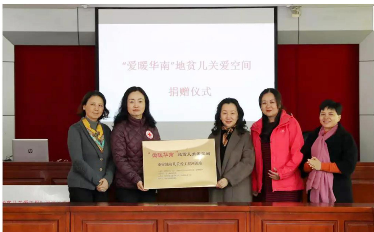
（爱暖华南河源站“地贫儿关爱空间”启动仪式）