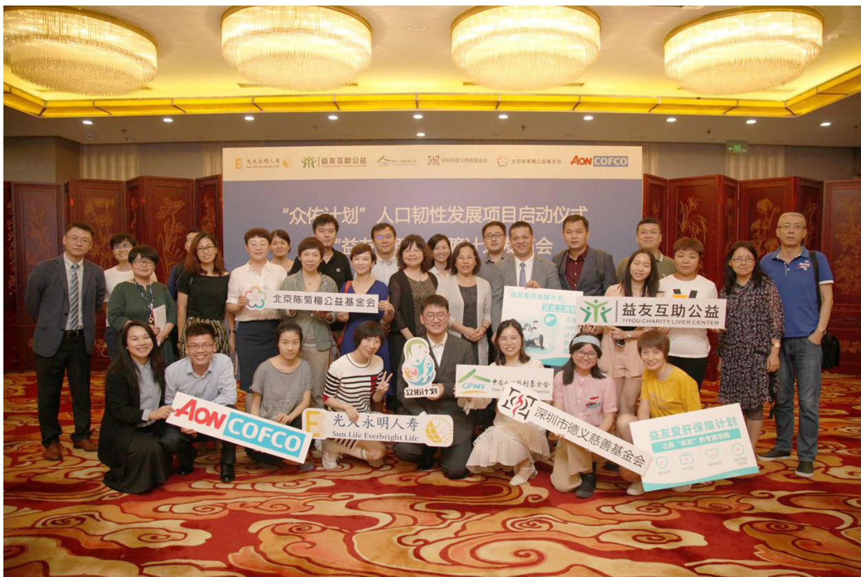
（“益友爱肝保障”发布仪式照片）