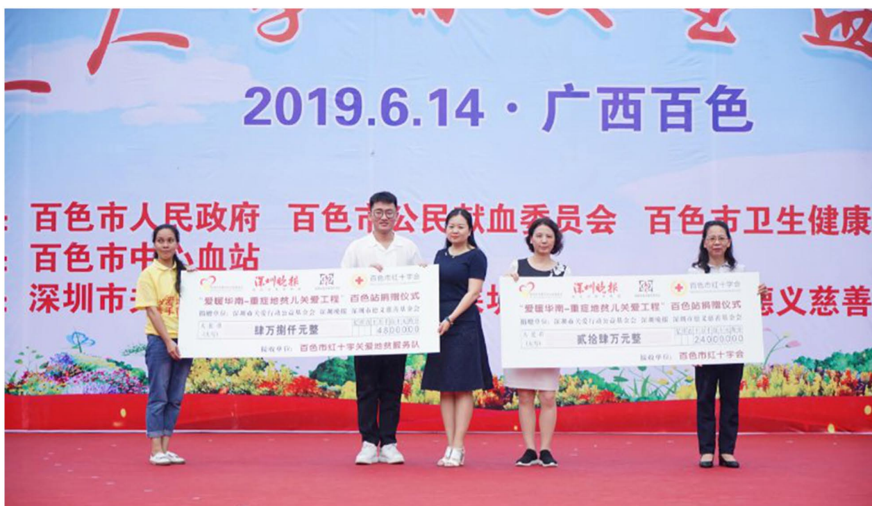
（深圳市关爱行动公益基金会、深圳晚报、深圳市德义慈善基金会 联合向百色市红十字会捐赠款物用于地贫家庭的关爱救助行动）