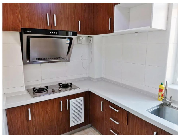
（图为北京小家干净的厨房）