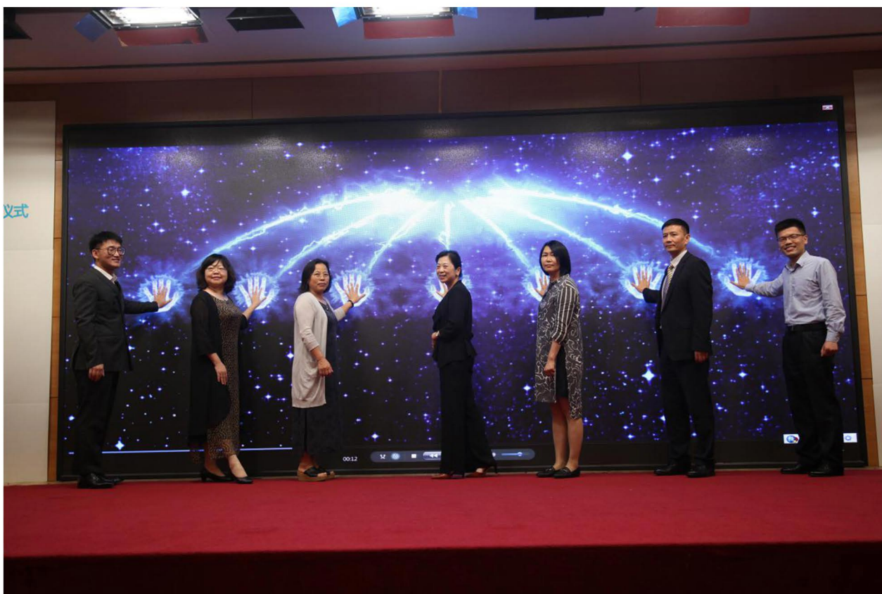
（图为众佑计划的启动仪式）