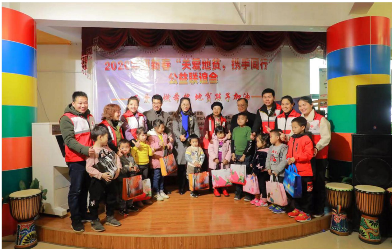
（本地志愿者组织的地贫关爱联谊活动）