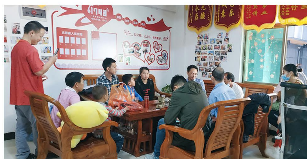
（图为广州小家举行家长聚会及慰问活动）