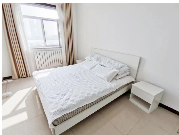
（图为北京小家整洁的卧室）

项目启动阶段即制定了标准化管理程序，从选址、基础设施、招募渠道、入住流程、日常管理、入住管理制度等开始梳理和制定。管理制度为小家正常运作提供了坚实基础，为项目持续运营提供保障。