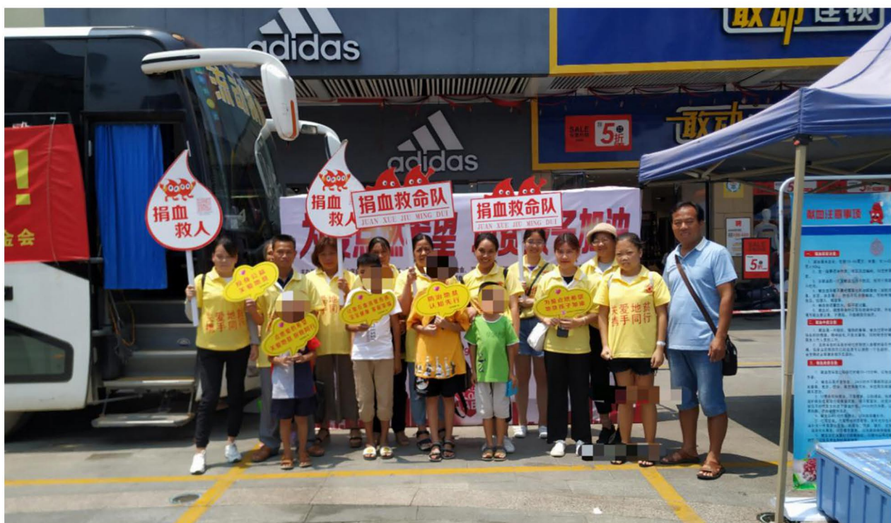
（本地志愿服务团队组织的鲜血倡导活动）