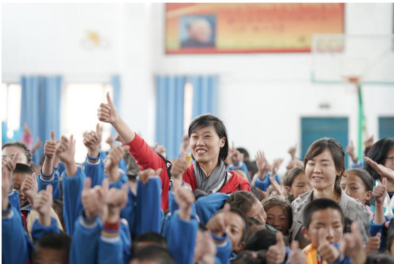
（ 图为工作人员在曲麻莱助学时与学生们合影 ）