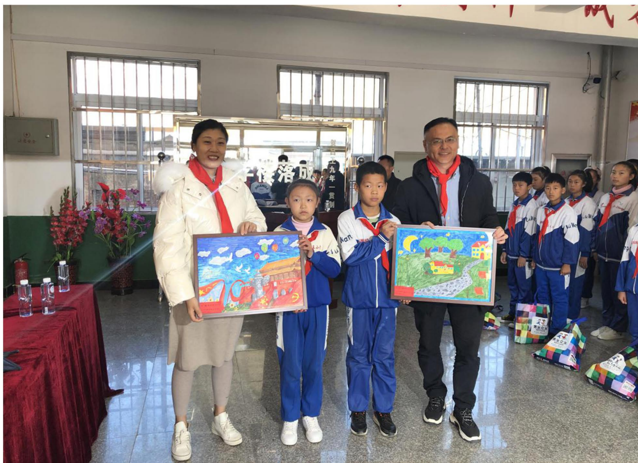
（图为受助学生向工作人员赠送其绘画作品）

在曲麻莱给 45 个家庭困难儿童发放教育生活补助，每人 1100 元标准，共计 49500 元。在叶格乡寄校做小组互动，资助了 32 名学生。在助学的路上，我们除了给孩子们生活上的补助，更加希望多一些机会陪伴孩子们的成长。随后项目执行团队来到辽宁和湖南，资助了辽宁 76 名中小學生，湖南 62 名学生（含 35 名高中生）。