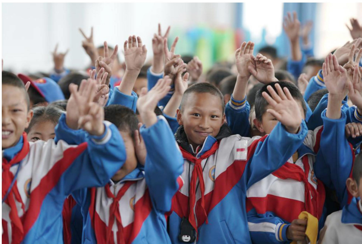
（ 图为受助学校的学生向工作人员开心的招手 ）